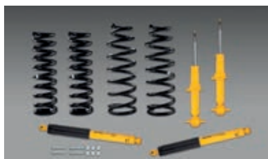
Phuộc sau OME Everest sau 2022