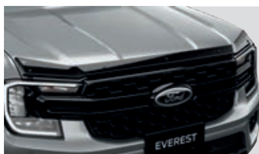
Ốp nắp capo