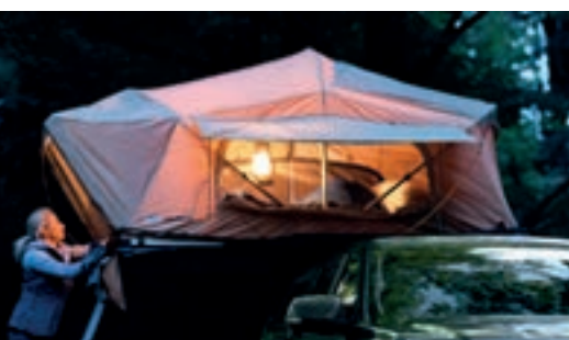
Lều gắn nóc ARB