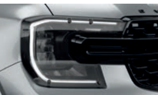
Ốp đèn trước