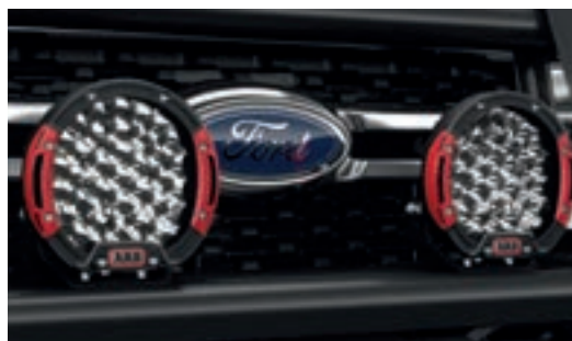
Đèn Led ARB hiệu suất cao