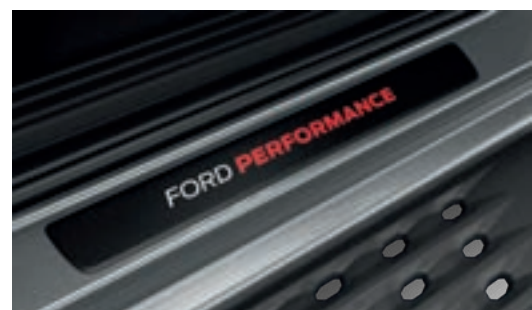
Ốp bậc cửa