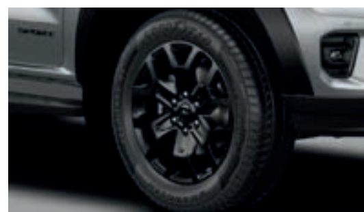
Ốp cua lốp