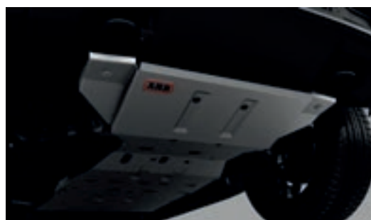
Giáp gầm ARB