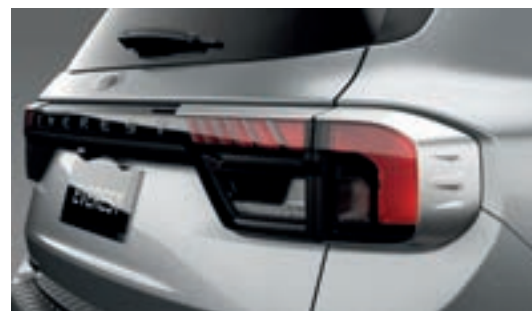
Ốp đèn hậu