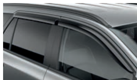
Vè che mưa